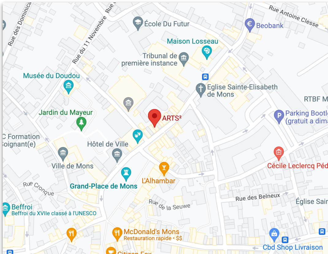
ARTS 2 - 7 rue de Nimy, 7000 Mons (Belgium)