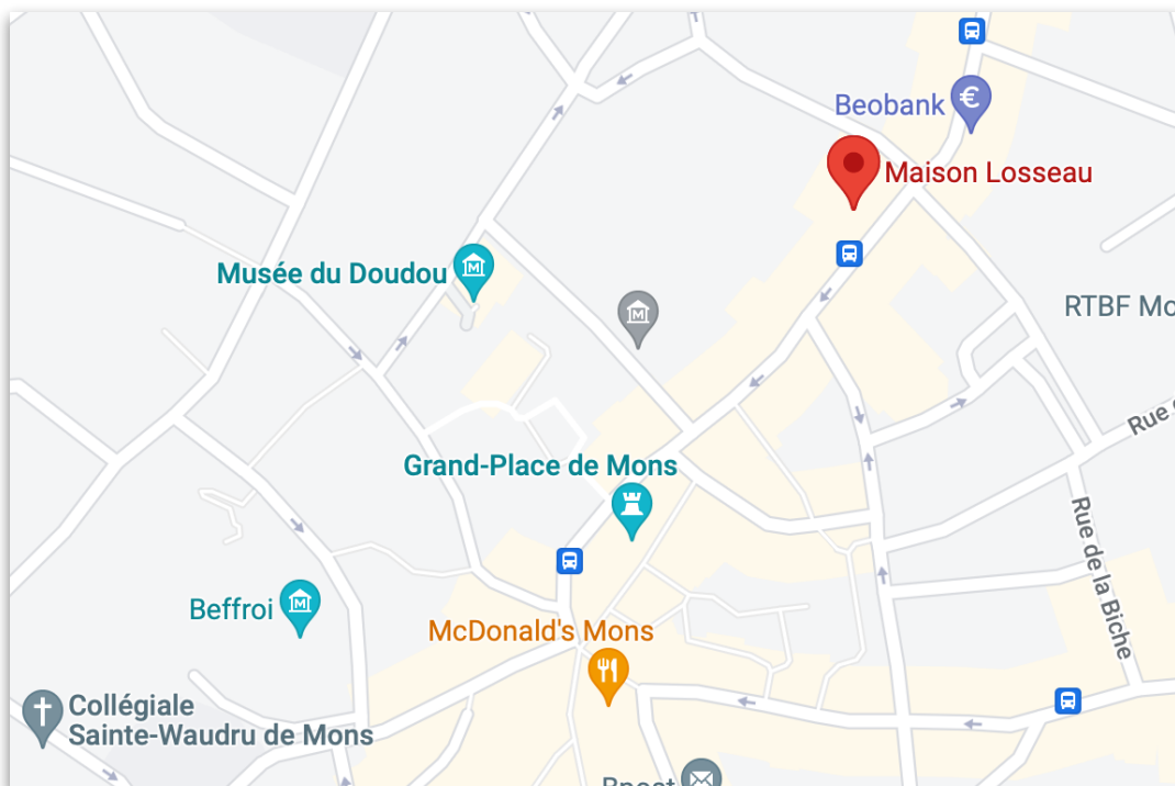
Maison Losseau - 37/39 rue de Nimy, 7000 Mons (Belgium)